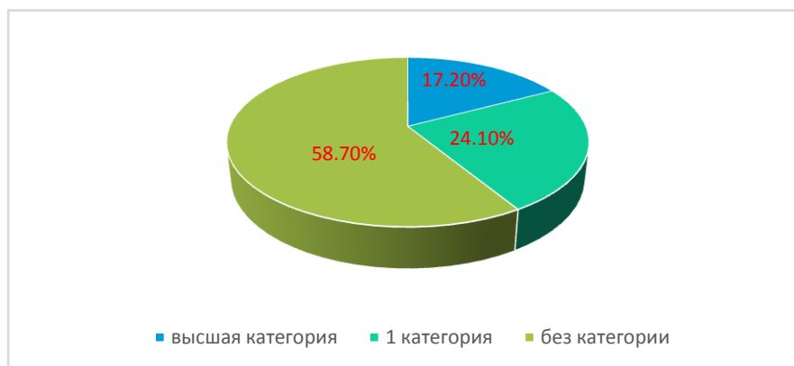
Диаграмма квалификационного уровня педагогов

В 2017 г. педагогические работники участвовали в профессиональных конкурсах, семинарах, публиковали материалы в научно-образовательных журналах: